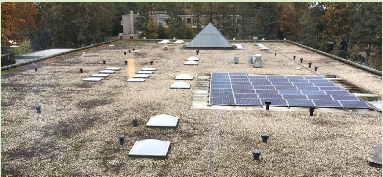
Dak van het Elzendaalcollege, nog ruimte genoeg

We hebben een positief gesprek gehad met het Elzendaalcollege in Gennep. Er liggen al panelen op het dak voor eigen gebruik maar de school wil graag meewerken aan het plaatsen van coöperatieve zonnepanelen om zodoende een maatschappelijke en buurtfunctie te vervullen. Voordat extra panelen geplaatst kunnen worden moet wel het dak grotendeels worden vernieuwd. De school is verantwoordelijk voor het onderhoud van het gebouw, heeft een voorziening voor het vervangen van het dak en kan zelf beslissen wanneer dit wordt uitgevoerd, misschien al in 2024.