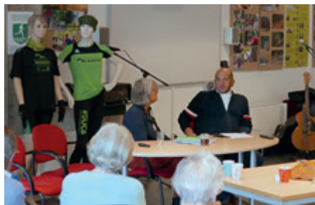
Zondagmorgensalon Interviews met 'Molenhoekers in het nieuws', muziek, columns en debat.