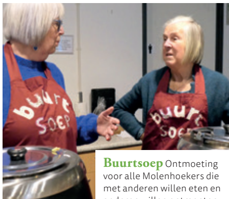
Buurtsoep Ontmoeting voor alle Molenhoekers die met anderen willen eten en anderen willen ontmoeten.